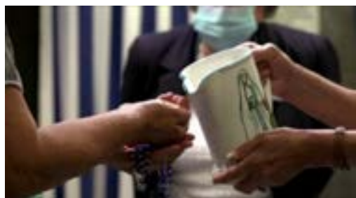
Il gesto dell'acqua