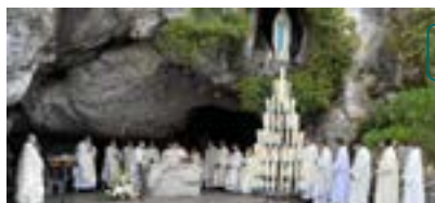
Messa alla grotta